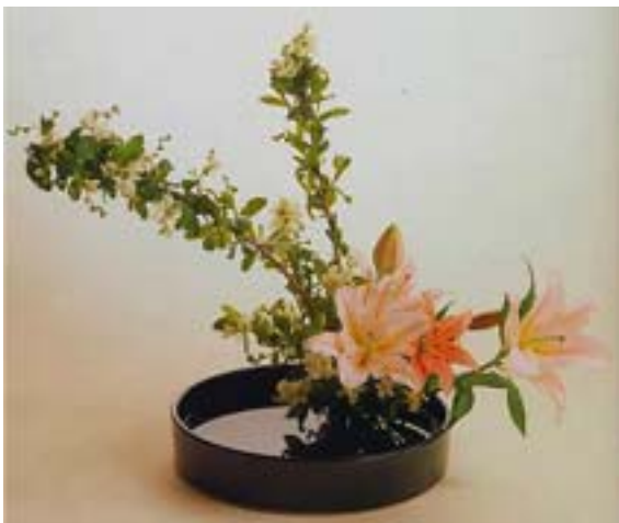
Un arrangement typique appelé moribana sogetsu est réalisé

L'Ikebana désigne en japonais un arrangement floral dont la tradition remonte à plus d'un millénaire. L'accent mis sur la perfection linéaire n'a d'égal que l'attachement aux enseignements de la nature et la compréhension de la croissance naturelle des végétaux utilisés. L'écoulement du temps est l'un des grands thèmes du symbolisme de l'art floral japonais. Tout bouquet doit suggérer de quelque façon une saison ou un climat. Par exemple le printemps, c'est le bourgeonnement et la vigueur; l'été, le foisonnement et la luxuriance; l'automne, le dépouillement et la couleur; une fête ou un anniversaire, la convivialité et la joie.